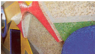
Mural de André Bloc .

Partiendo de lo anterior, la cuestión a determinar sería la siguiente: ¿constituye el referido artículo 8 de la LOPNNA una norma de referencia para interpretar los tipos penales establecidos en la ley? Una posible respuesta se basaría en la literalidad del artículo 8, el cual afirma que ese principio se tendrá en cuenta para la interpretación de la ley , sin distinguir si se trata de toda la ley o de las disposiciones directamente vinculadas a la protección del NNA. Obviamente, esta simple interpretación deja un mal sabor de boca en cuanto a la racionalidad en la aplicación de la ley. En efecto, ¿podría violentarse el principio de legalidad de los delitos y las penas en aras de un supuesto “interés superior del niño”? Es decir, ¿podría rebasarse “el sentido literal posible” de los tipos penales, ampliarse el supuesto de hecho típico, con el fin de evitar la impunidad de hechos que lesionan intereses de los NNA? La respuesta afirmativa pueda que complazcan a algunos defensores de los intereses de los NNA, sin embargo escandalizaría a cualquier penalista medio.